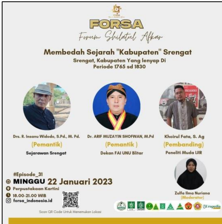
Gambar 1: Pamlet kegiatan membedah sejarah “Kabupaten Srengat” pada Forum Shilatul Afkar (Dokumentasi, 2023)