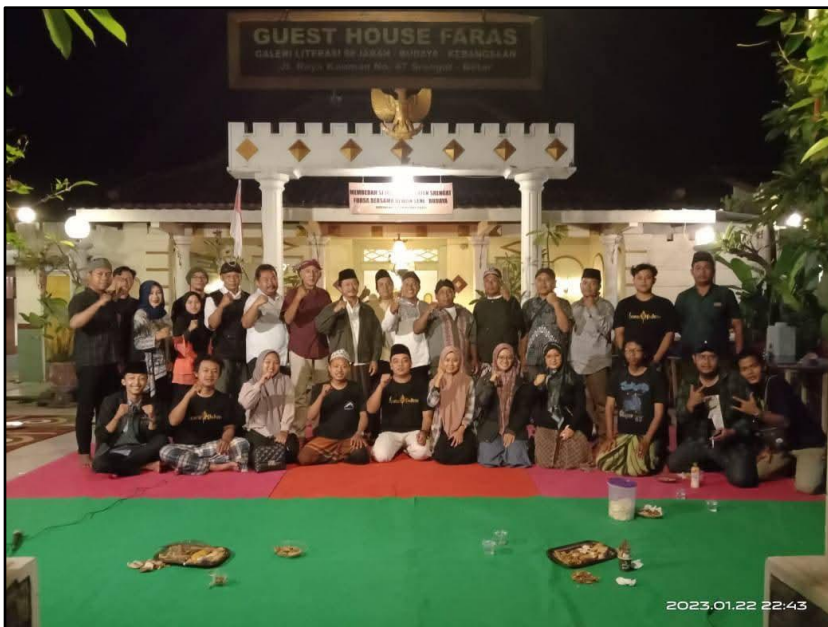
Gambar 4: Para peserta kegiatan membedah “Kabupaten Srengat” pada Forum Shilatul Afkar (Dokumentasi, 2023)

Peta semacam ini biasanya mencakup detail seperti batas wilayah, sungai (misalnya Sungai Brantas yang melintasi Kediri), jalan, pemukiman, dan mungkin juga lahan pertanian atau perkebunan, yang penting bagi perekonomian kolonial. Angka "0,11" bisa merujuk pada bagian spesifik dari peta Keresidenan Kediri, mungkin menunjukkan lokasi tertentu seperti Kota Kediri atau daerah sekitarnya. Berdasarkan informasi yang tersedia, peta seperti Kaart van de Residentie Kediri diterbitkan oleh Topographisch Bureau pada tahun 1891, dan cetak ulang pada 1892 mungkin mencerminkan perbaikan atau distribusi ulang. Peta tersebut bisa ditemukan dalam koleksi digital, seperti yang diarsipkan oleh Universitas Leiden Belanda.