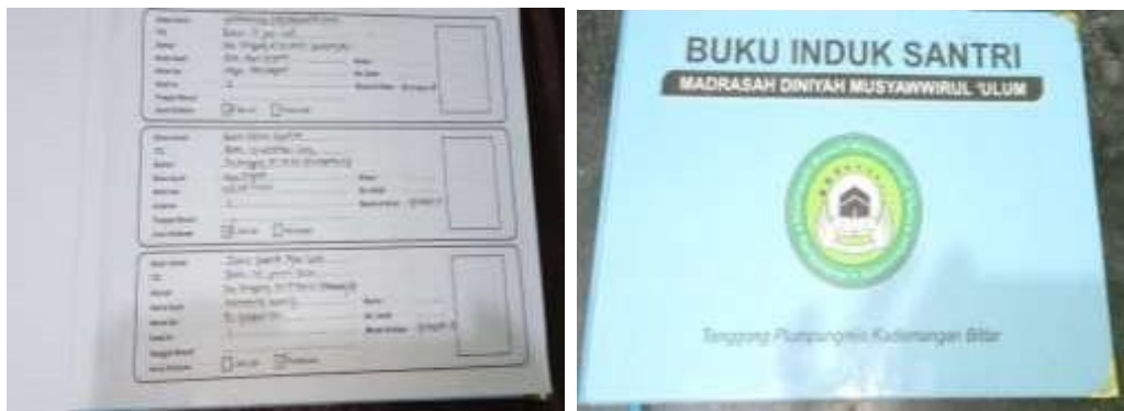
Gambar 4.1 Format Buku Induk Santri

Dokumentasi di atas merupakan format buku induk santri madrasah diniyah mustawirul ulum.