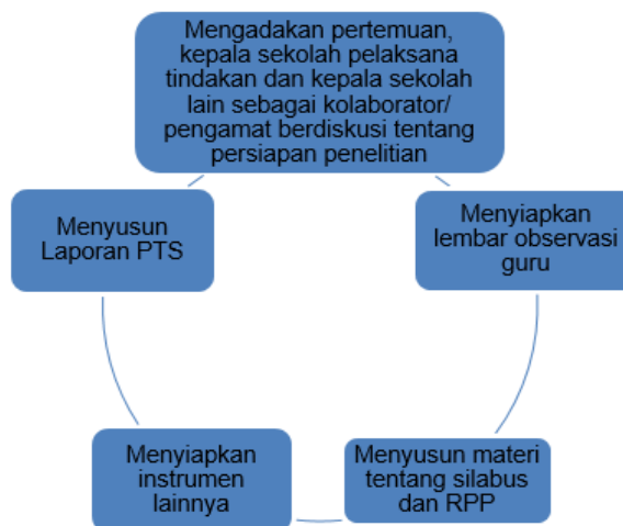
Gambar 1. Perencanaan PTS

Prosedur penelitian terdiri dari 6 tahap diantaranya perencanaan (Gambar 1.), pelaksanaan, tindakan, observasi, evaluasi dan refleksi.