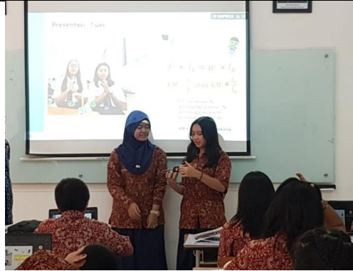
Gambar 1 Presentasi Proyek STEAM Pesawat Sederhana