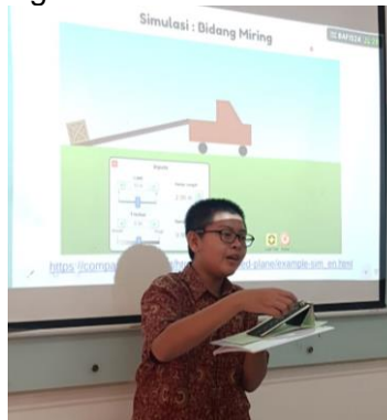
Gambar 3 Proyek STEAM Pesawat sederhana dengan simulasi PhET

N-gain total = 0,71 (kategori tinggi), meningkat dari siklus III analisis yang ditemukan: 1) visualisasi membantu siswa menghubungkan panjang–tinggi–gaya pada bidang miring, 2) reasoning menjadi lebih kausal dan terstruktur, 3) penggabungan data eksperimen nyata dan simulasi meningkatkan validitas evidence, 4) lebih dari 80% siswa mencapai ketuntasan argumentasi.