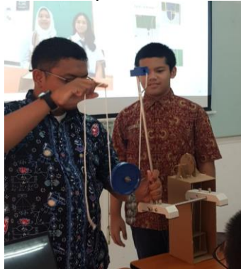
Gambar 2 Proyek STEAM ditambah demonstrasi Kit Pesawat Sederhana

N-gain total = 0,45 (kategori sedang), meningkat dari siklus I. Temuan utama data lebih konsisten, reasoning mulai berkembang, namun masih terbatas pada konsep katrol yang kompleks, siswa belajar menjelaskan hubungan gaya–jumlah tali penopang. Refleksi siklus II terdapat masalah yang tersisa: 1) siswa kesulitan memprediksi perubahan variable, 2) eksperimen fisik memakan waktu dan sulit divariasikan, 3) perlu media visual untuk memperkuat konsep. Perbaikan lanjut: penggunaan simulasi PhET untuk mempermudah visualisasi hubungan antarvariabel.