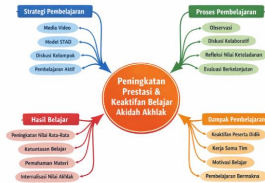
Gambar 2. Mind Map Peningkatan Prestasi dan Keaktifan Belajar

Hasil penelitian ini juga menunjukkan bahwa keberhasilan pembelajaran tidak hanya ditentukan oleh satu faktor, tetapi merupakan hasil sinergi antara media pembelajaran yang tepat, model pembelajaran yang sesuai, dan kemampuan guru dalam mengelola kelas secara reflektif dan adaptif (Creswell, 2014; Sukmadinata, 2017).