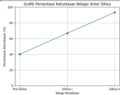
Gambar 1. Grafik Persentase Ketuntasan Belajar Bahasa Arab Siswa Antar Siklus

Dengan tercapainya indikator keberhasilan pada siklus II, penelitian tindakan kelas ini dihentikan tanpa melanjutkan ke siklus berikutnya.