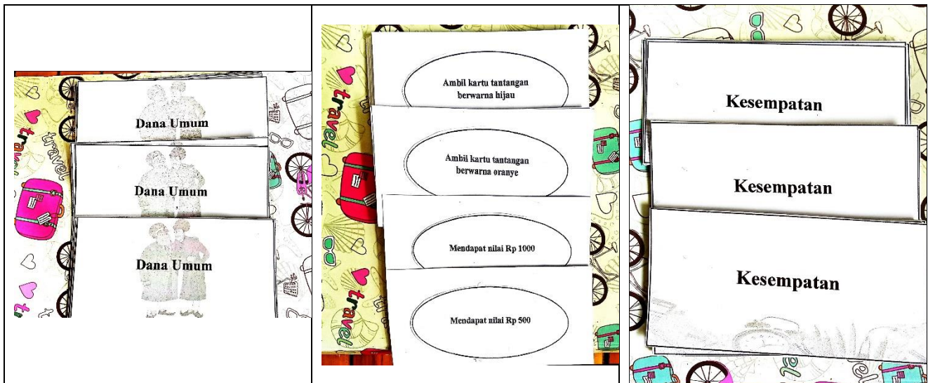
Gambar 4. Kartu “dana umum” dan “kesempatan”