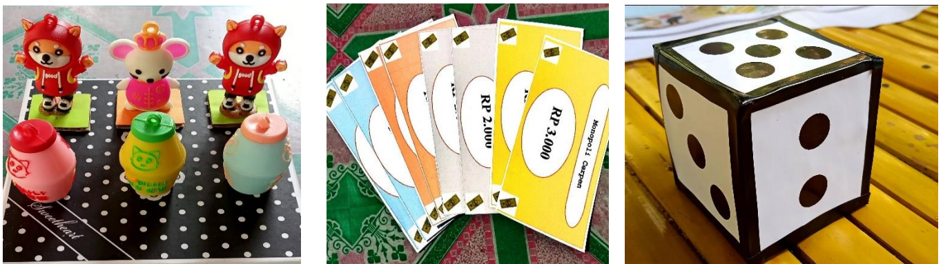
Gambar 2. Pion, dadu, uang Monopoli Cerpen

Produk ini terdiri dari 36 kotak yang setiap kotaknya berukuran 4,5 cm. Tiga kotak bergambar penjara, delapan kotak bergambar kartun, enam kotak bergambar kartu tantangan berwarna oranye, enam kotak bergambar kartu tantangan berwarna hijau, enam kotak bergambar tanda tanya, dan satu kotak bertuliskan mulai/selesai. Selain itu ada dua kotak berukuran panjang 17 cm dan lebar 10 cm yang berwarna hijau dan oranye bertuliskan kartu tantangan. Dua kotak berukuran panjang 10 cm dan lebar 5 cm bertuliskan dana umum dan kesempatan. Media ini dimainkan menggunakan empat pion, satu dadu, dan sejumlah uang. Dadu yang digunakan terbuat dari kertas karton berukuran 5 cm, dan uang yang terdapat dalam permainan ini dicetak menggunakan kertas buffalo .