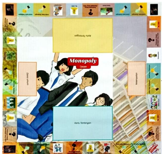
Gambar 1. Media Monopoli Cerpen

Penelitian dan pengembangan yang telah dilakukan ini menghasilkan sebuah produk berupa media Monopoli Cerpen untuk menganalisis unsur pembangun cerita pendek. Media ini dikembangkan dengan beberapa aspek yang meliputi aspek tampilan dari media, aspek penyajian media, aspek ketepatan media, aspek ketertarikan media, aspek kesesuaian materi, aspek penyampaian materi, dan aspek materi. Media ini didesain menggunakan aplikasi Adobe Illustration yang kemudian dicetak menggunakan kertas banner berukuran 45cm x 45cm. Berikut gambar media permainan Monopoli Cerpen yang disajikan pada gambar 1.