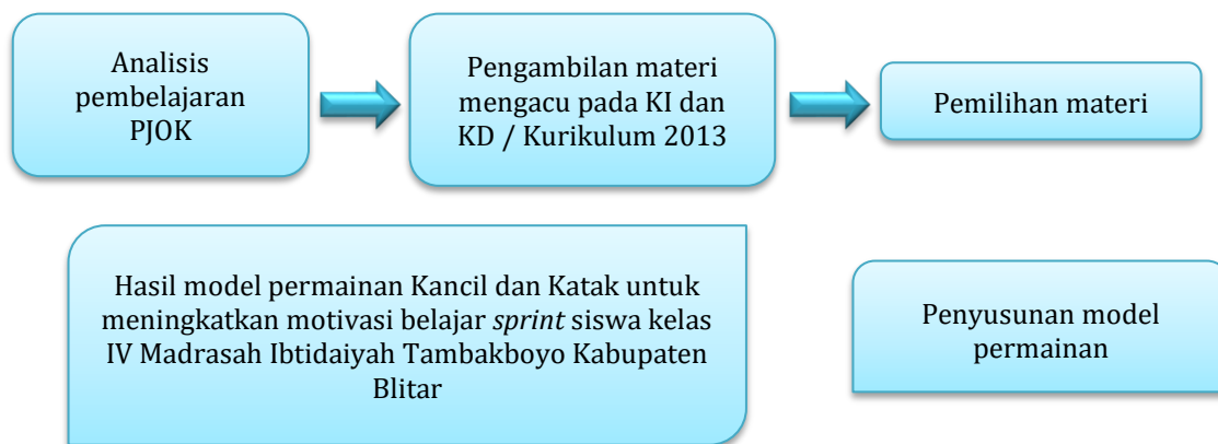
Gambar 1. Bagan Merancang Produk Awal

Pada tahap merancang produk awal pengembangan model permainan Kancil dan Katak terdapat bagan alur pembuatan produk yang terdapat pada bagan sebagai berikut: