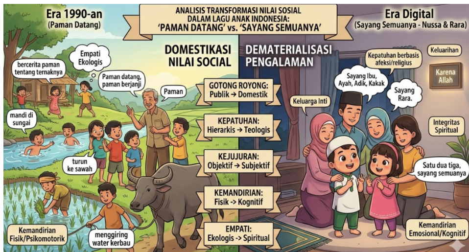
Gambar 1: Analisis Transformasi Nilai Sosial Dalam Lagu Anak Indonesia

Transformasi ini juga terlihat dari hilangnya diksi-diksi lokalitas yang mendukung nilai gotong royong komunal. Kata-kata yang merujuk pada ruang publik alami dalam lagu "Paman Datang" menghilang dan digantikan oleh ungkapan afektif yang repetitif dalam lagu "Sayang Semuanya", seperti pada kode L7SS (" Semuanya... saling menyayangi "). Pergeseran makna "bersama-sama" dari aktivitas fisik bersama warga desa menjadi aktivitas emosional bersama keluarga inti mencerminkan perubahan sosiologis masyarakat urban Indonesia. Anak-anak era digital cenderung dikondisikan untuk membangun solidaritas dalam kelompok kecil yang terkontrol, yang secara tidak langsung mengurangi frekuensi interaksi sosial dengan realitas masyarakat yang lebih luas dan beragam di luar lingkup domestik mereka.